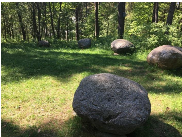
Kunghögarna i Mjölby. Ett gravfält från järnåldern.

Kyrkoguidningar i kyrkor som inte guidats så ofta, Skänninge marknads historia, Lunds backe och Öjebro har lockat flest besökare. (2016 30st. 2017 51st.)