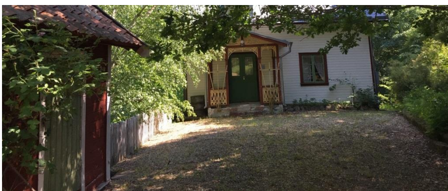
Skånska Lasses hus i Mjölby.

Östergötlands museum gjorde på uppdrag av kommunen en byggnadsdokumentation av Skånska Lasses Hus. Resultatet är en detaljerad information på hela 37 sidor. (2016). Huset används som museum och visas på beställning för grupper och besöktes under juli av en större grupp ättlingar till Skånska Lasse från Amerika. (2016).